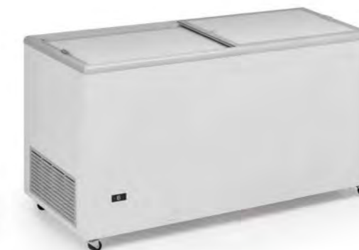
ICE 500 NTOS