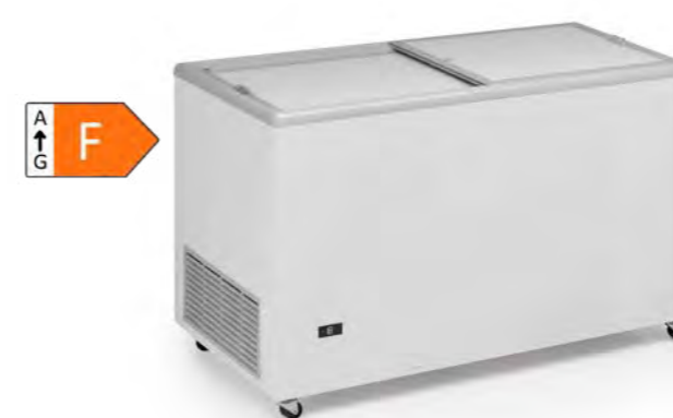
ICE 400 NTOS