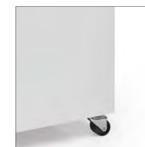
Ruedas para facilitar el desplazamiento.