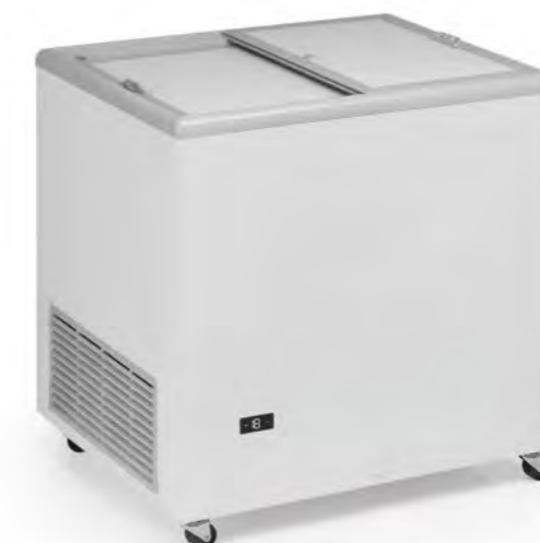
ICE 220 NTOS