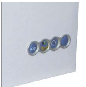
Cuadro de mandos.