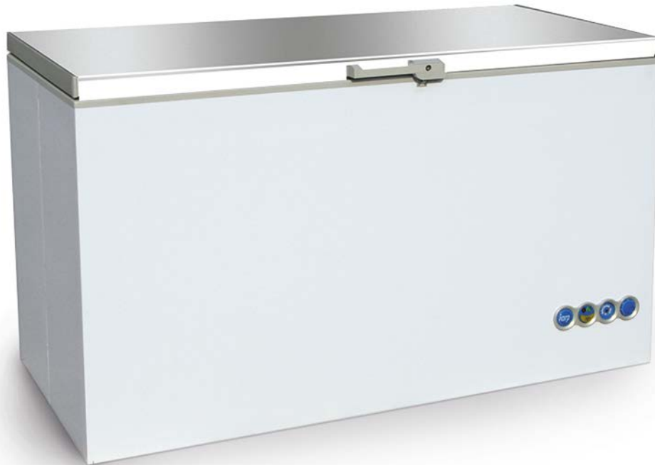
CF 700 Blanco (1 tapa)