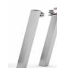
SOPORTE RECTANGULAR INCLINADO