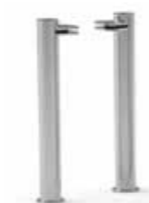
SOPORTE REDONDO Ø 50 mm