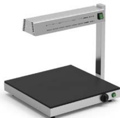
Ejemplo pantalla mantenedora PMC con placa caliente PCV-5050