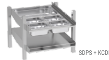
SDPS + KCDP