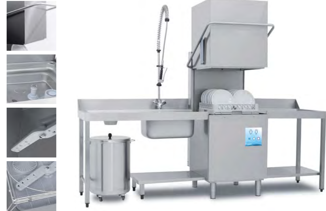
FAST 80 con accesorios