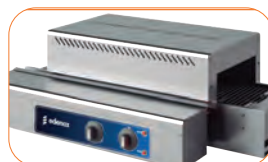
Regulación independiente de las resistencias, superior e inferior, con led señalizador de funcionamiento.