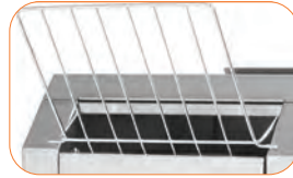
Resistencias blindadas en la parte superior e inferior.