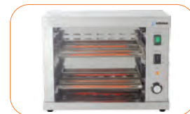
Resistencias eléctricas de cuarzo.