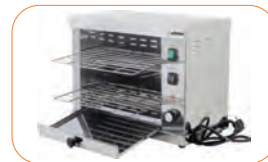
Bandeja recoge-migas extraíble.