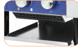
Bandeja recoge migas extraíble.