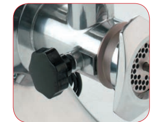
Completamente desmontable para una fácil limpieza.