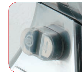
Interruptor marcha-paro con relé.