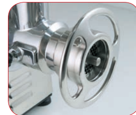
Detalle de la boca de la PI-22-U con sistema 1/2 Unger.