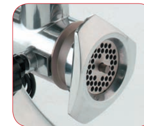
Detalle de la boca.