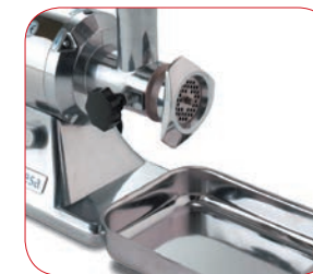
Con bandeja de recogida en acero inoxidable incorporada.