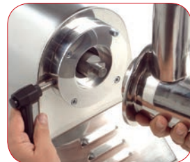
Modelo PI-32 con boca fácilmente desmontable para su limpieza.