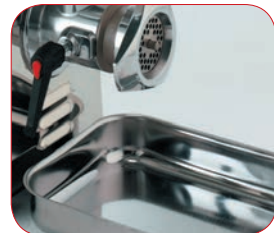
Bandeja de recogida en acero inox.