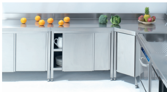
Mesa de ángulo MMAP-106. La mesa de ángulo permite crear una línea continua y homogénea de mesas de trabajo y fregaderos.