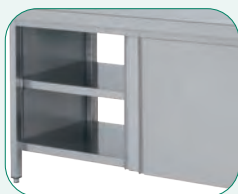
Tirador incorporado en toda la altura de la puerta.