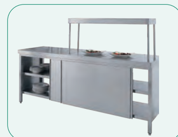
Opcionalmente a las mesas se les puede instalar fácilmente un conjunto de estanterías (ver página 58)