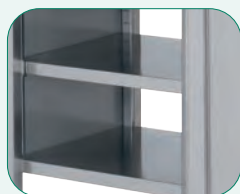
Estante regulable en 7 niveles cada 41 mm.