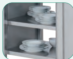
El estante va de extremo a extremo sin dejar espacios huecos.