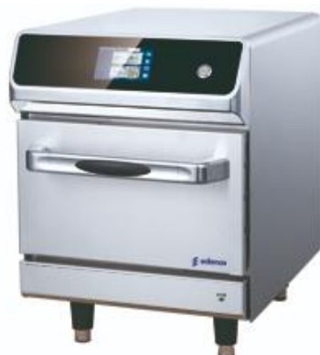
Cocción y Hornos - Horno de alta velocidad - Chef-N-Go!