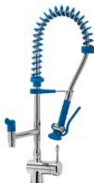
Preparación estática - Grifería industrial - Grifería industrial - Grifos ducha