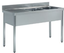
Fregaderos industriales Soldados a bastidor gama 600 y 700 - Gama lavavajillas