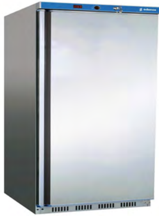
Frio Comercial - Armarios refrigerados en ABS - Armarios refrigerados