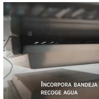
INCORPORA BANDEJA RECOGE AGUA