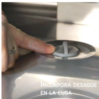
INCORPORA DESAGÜE EN LA CUBA