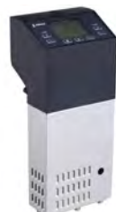
Sous Vide portátil