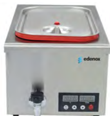
Sous Vide Baño María estático