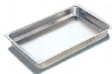
Recipientes GN de acero inoxidable Cubetas lisas sin asas