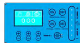
Panel de mandos digital.