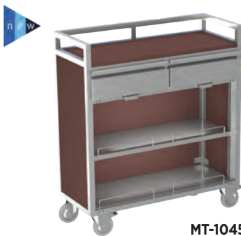
MT-1045 C S1