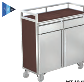
MT-1045 CP S1