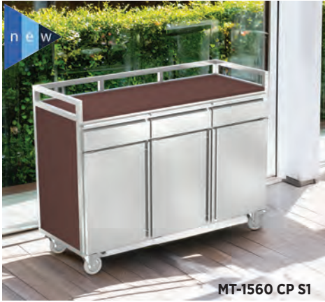
MT-1560 CP S1

Mesa terraza MT-1560 CP. Con espacio para la caja registradora, cajones para cubiertos y porta bandejas. Cómodas puertas abatibles con ruedas para retirar la mesa, espacio interior para almacenar vajilla, elementos de limpieza o servilleteros, etc.