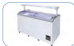
Dotado de cestas en el interior para una mejor distribución de los productos.