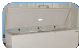
Incluye luz interna LED, que funciona al abrir la puerta.