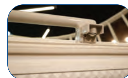
Incluye cerradura con llave y termostato.