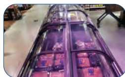
Gran capacidad de volumen interior útil.