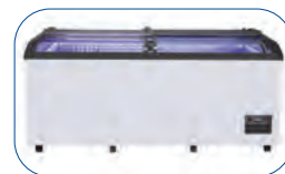
4 puertas de vidrio deslizante