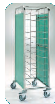
CBC-12 + 2 paneles PCBC