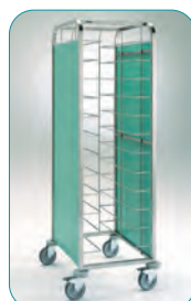
CBC-12 + 2 PCBC