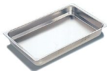
Recipientes GN de acero inoxidable Cubetas lisas sin asas