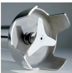
Brazo de acero inoxidable con cuchilla de 3 lamas (*).