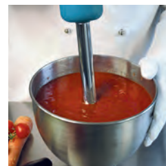
Simplicidad de uso. Alta resistencia, ideal para usos profesionales.