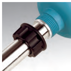
Fácil y seguro montaje de los brazos con el bloque motor.