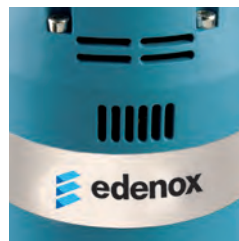
Ranuras de ventilación en la parte superior del motor.