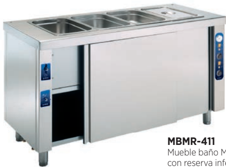
MBMR-411 Mueble baño María con reserva inferior caliente.