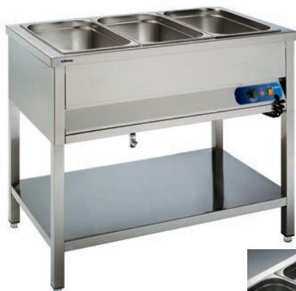
BMSR-311 (Cubetas no incluidas)