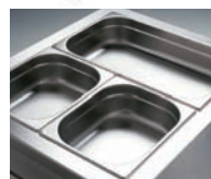
Profundidad máxima de cubetas 200 mm.