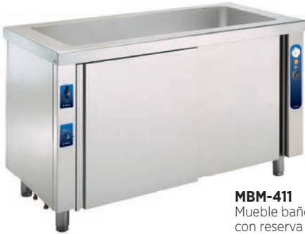
MBM-411 Mueble baño María con reserva inferior neutra