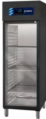
Frio Comercial - Armarios refrigerados en acero inox - Armario Inox - Serie GN 2/1 - Armarios Refrigerados GN 2/1