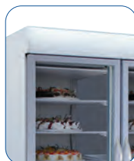
Display superior iluminado mediante tubo fluorescente.