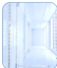
Gran capacidad de almacenamiento