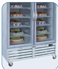
Incorporan 4 ruedas para facilitar el desplazamiento.