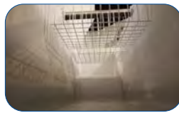
Gran capacidad de volumen interior útil.