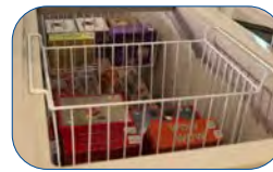
Dotado de cestas en el interior para una mejor distribución de los productos.