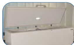
Incluye luz interna LED, que funciona al abrir la puerta.