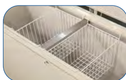
Cesta para arcón NLFG.