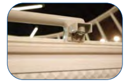
Como dotación se sirve cerradura con llave.