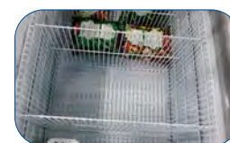
Parrillas divisorias para congeladores horizontales modelos IC se ruega consultar.