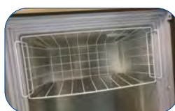
Cesta para arcón CNLF.