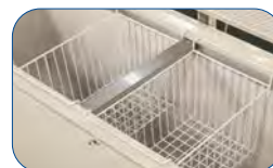
Como dotación se sirve una cesta en cada congelador.