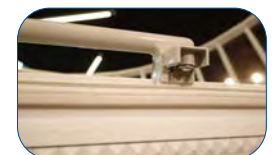
Incluye cerradura con llave y termostato.