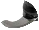
Cuchilla lisa Referencia CL8001