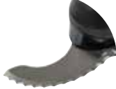
Cuchilla dentada Referencia CL8002