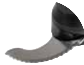
Cuchilla microdentada Referencia CL8003