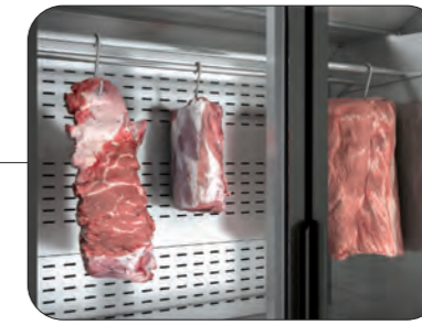
Detalle barras carniceras (opcional) Detail of butcher bars (optional) Détail des bars de boucherie (facultatif)