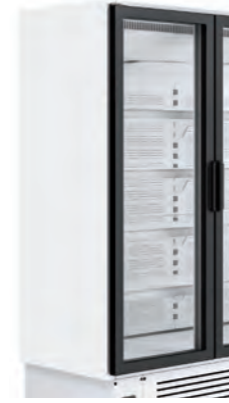
Detalle costado ciego

Disponible modelos refrigeración y congelados Available refrigerated and frozen models Modèles réfrigérés et congelés disponibles