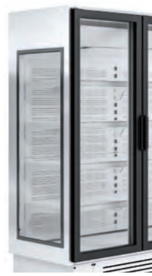
Detalle costado ventana

Disponible modelos refrigeración y congelados Available refrigerated and frozen models Modèles réfrigérés et congelés disponibles