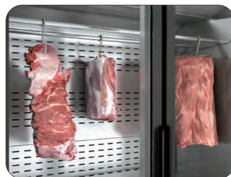
Detalle barras carniceras (opcional) Detail of butcher bars (optional) Détail des bars de boucherie (facultatif)