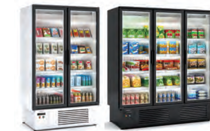
Decoración exterior total blanco o negro sin incremento de precio Total exterior decoration white or black without price increase Décoration extérieure totale blanc ou noir sans majoration de prix