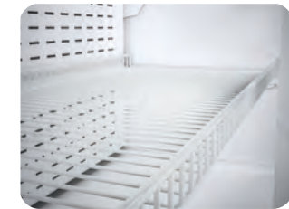
Estante varilla opcional Optional rod shelf Tablette à tiges en option