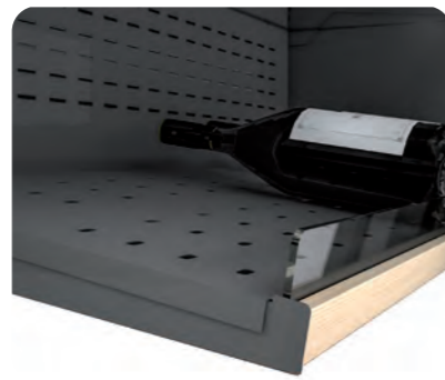
Detalle estante inclinado Inclined shelf detail Détail de l'étagère inclinée