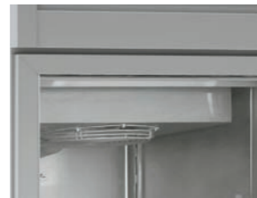
DETALLE EVAPORACION VENTILADA DETAIL VENTILATED EVAPORATION EVAPORATION VENTILE DETAIL