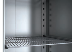
DETALLE PARRILLA DETAIL ADJUSTABLE SHELF TABLETTE RÉGLABLE DE DÉTAIL