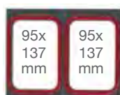
Molde de 2 barquetas