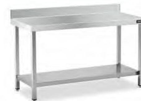
Mural con 2 estantes