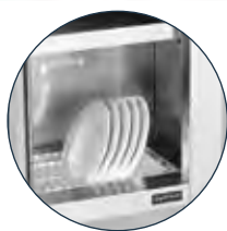
Modelo con escurreplatos