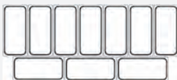
DISPOSICIÓN CUBETAS 5 LTS. EXPOSICIÓN BRAVA/BERMUDA 10