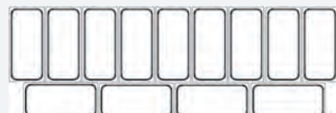
DISPOSICIÓN CUBETAS 5 LTS. EXPO- SICIÓN BRAVA/BERMUDA 13