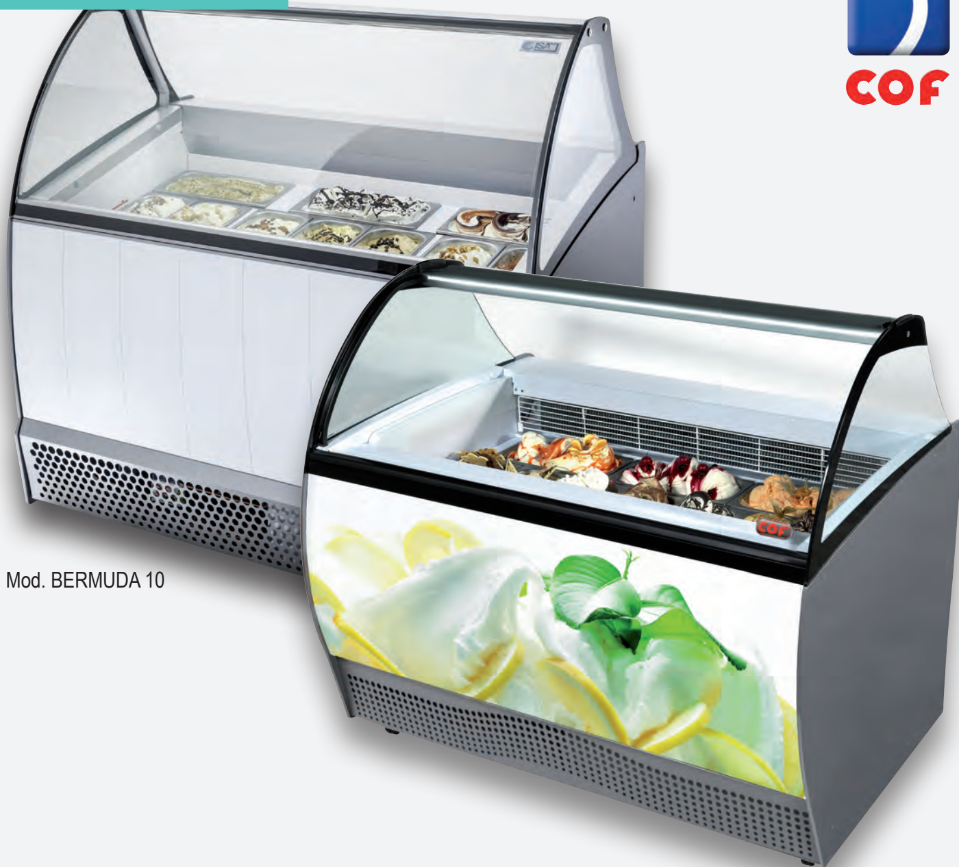
Mod. BERMUDA 10