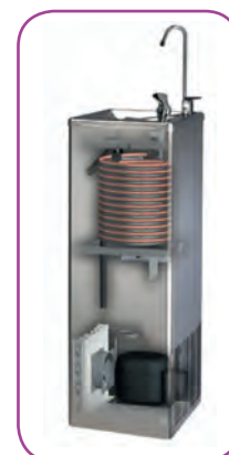
Detalle interior fuente