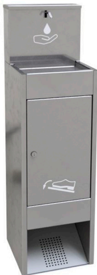
Ref. : 3311