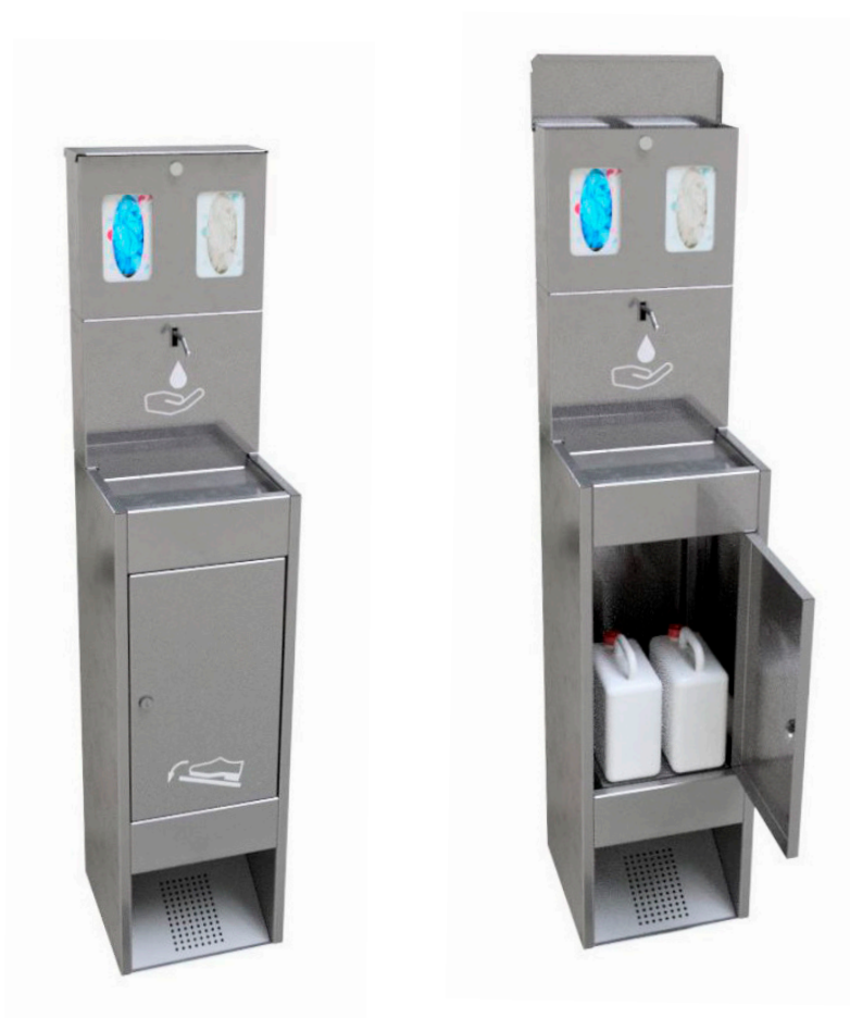
Ref. : 3311-EPIS