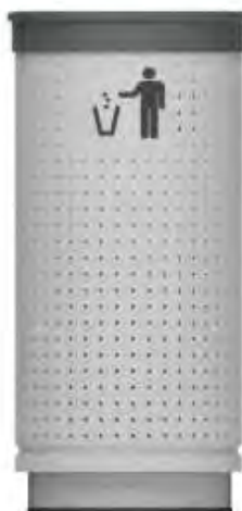
680PE / 780PE Base PEDESTAL