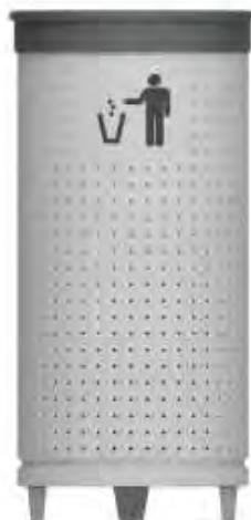
680PA/ 780PA Base PATAS