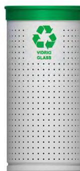
Punto verde 780BU 3R