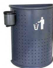
Ref.: 352 + cenicero 701