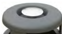
Detalle cenicero Ref.: 716