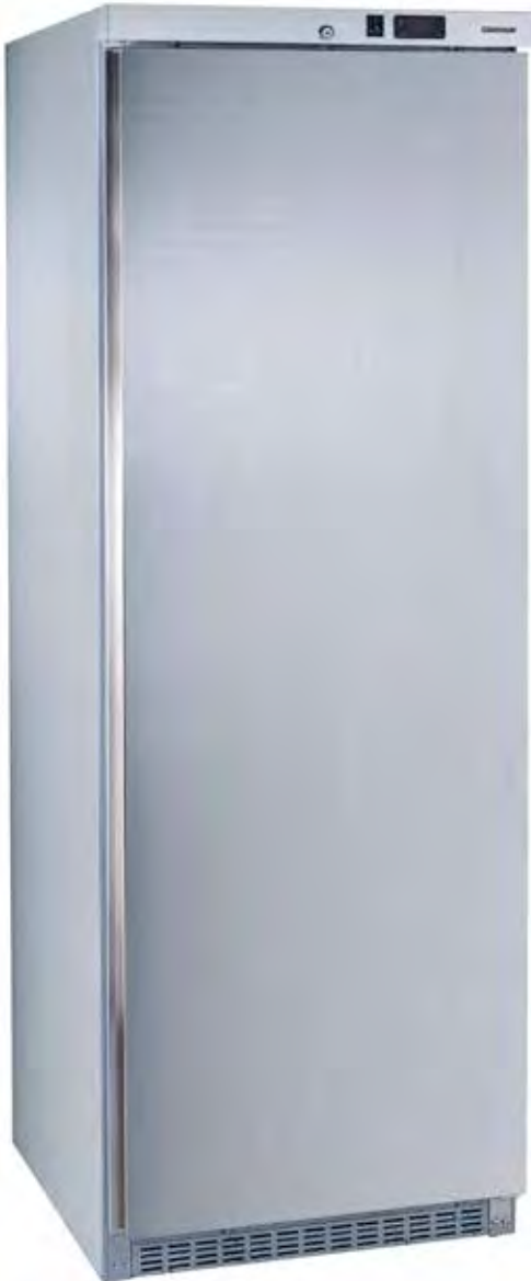
MAC460 PO A