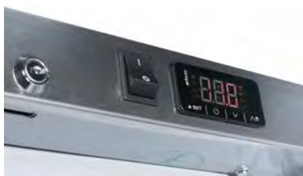
MAC460 PO BL