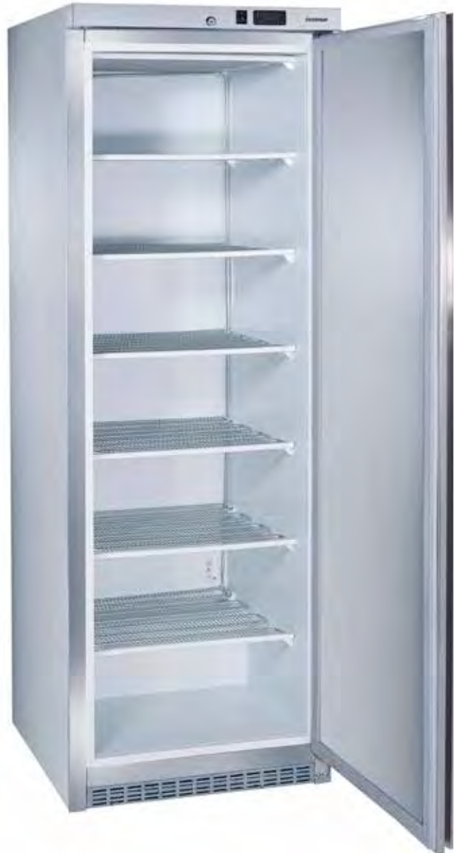
MAC460 PV BL