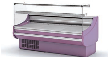
lacado total total lacquered