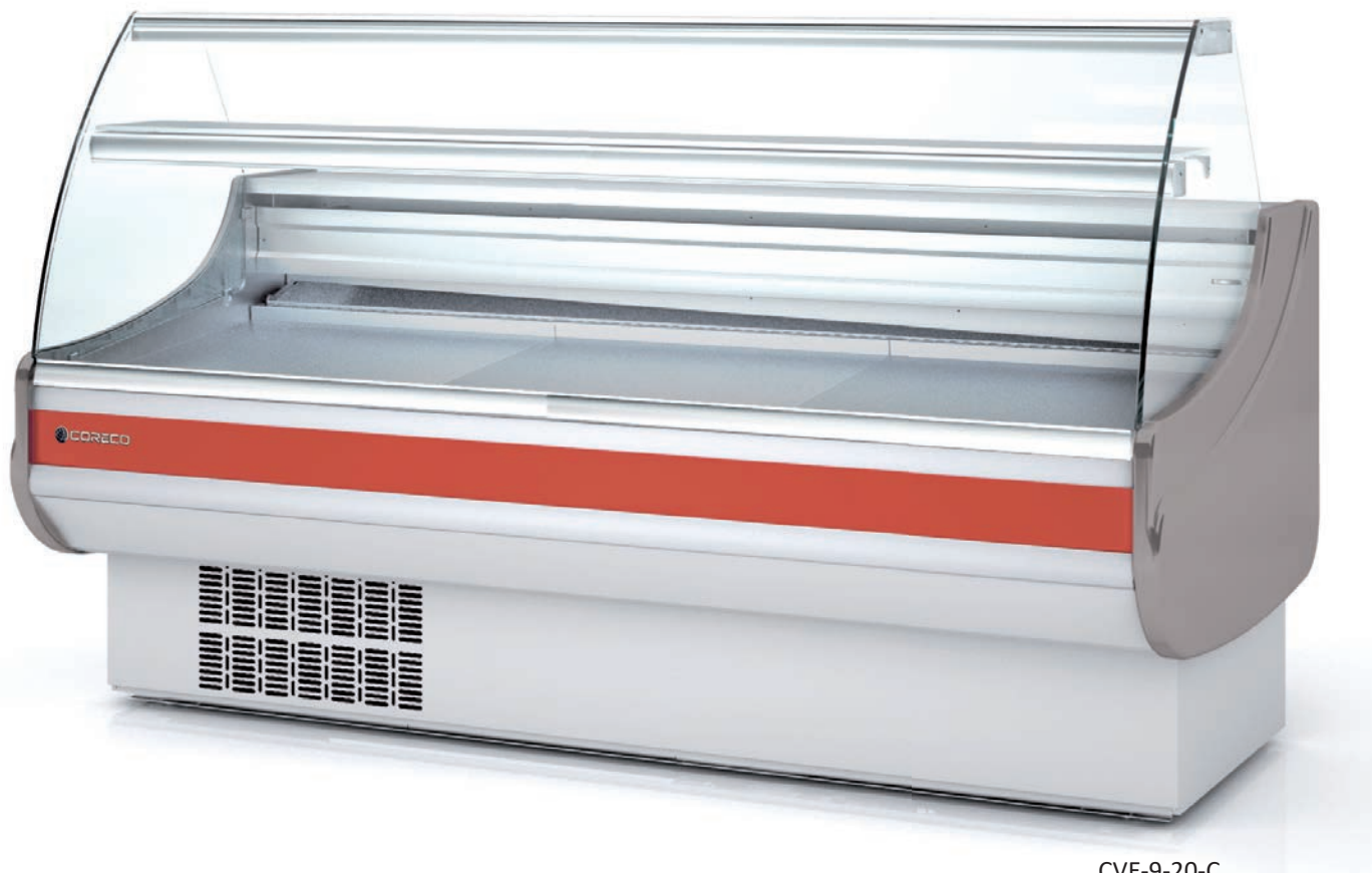
CVE-9-20-C decoración estándar standard decor