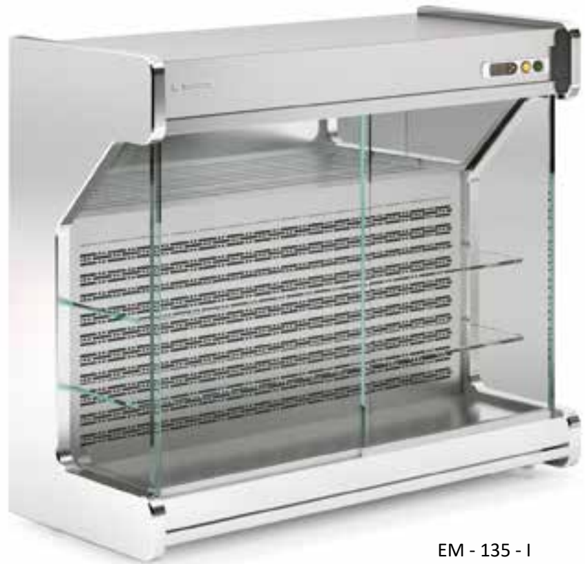
EM - 135 - I