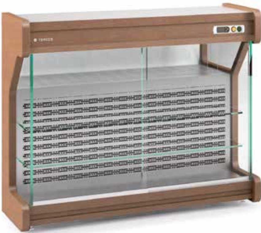
EM -135 -M