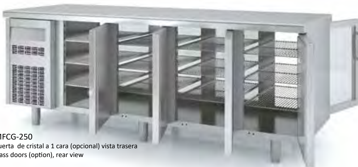
MFCG-250 puerta de cristal a 1 cara (opcional) vista trasera glass doors (option), rear view