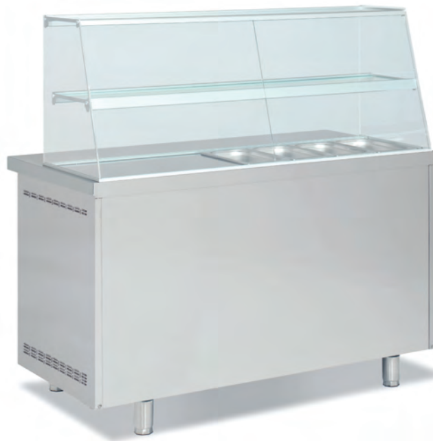
MFK70-135 Vista trasera Back side view