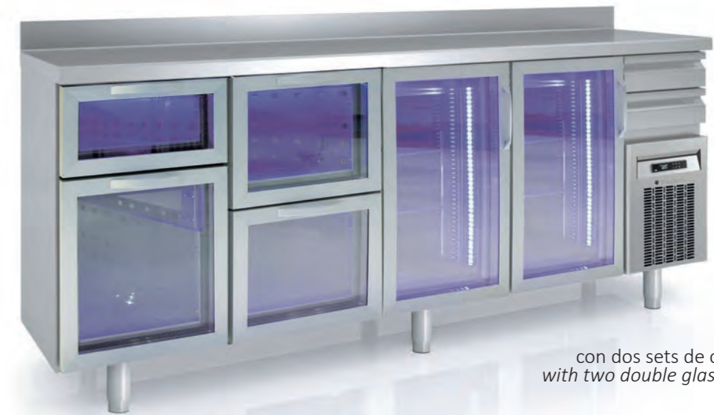
FMRV-250 con dos sets de cajones dobles with two double glass drawers sets