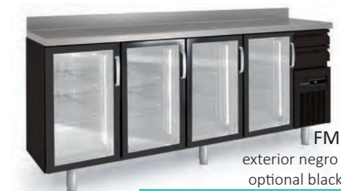
FMRV-250 exterior negro opcional optional black exterior

all photos must be considered as a reference - fotografías no contractuales