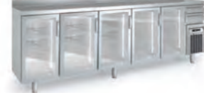
FMRV-300 4.108 €