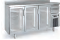
FMRV-200 2.980 €