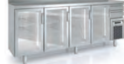
FMRV-250 3.550 €