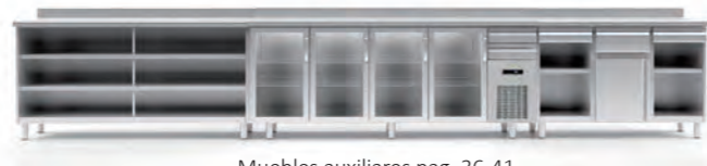
Muebles auxiliares pag. 36-41 Auxiliar furnitures pag. 36-41