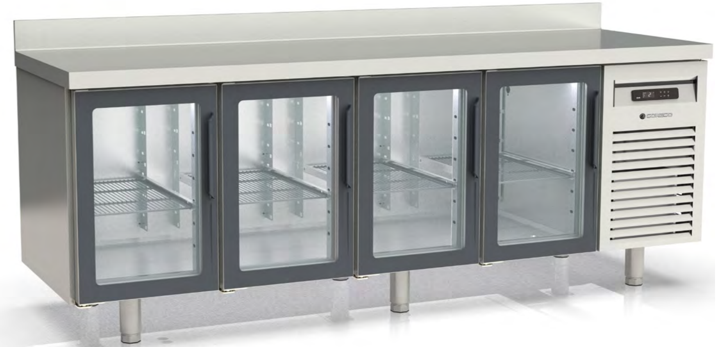
MRGV-250 dotación parrillas y contenedores extra with extra containers and shelves