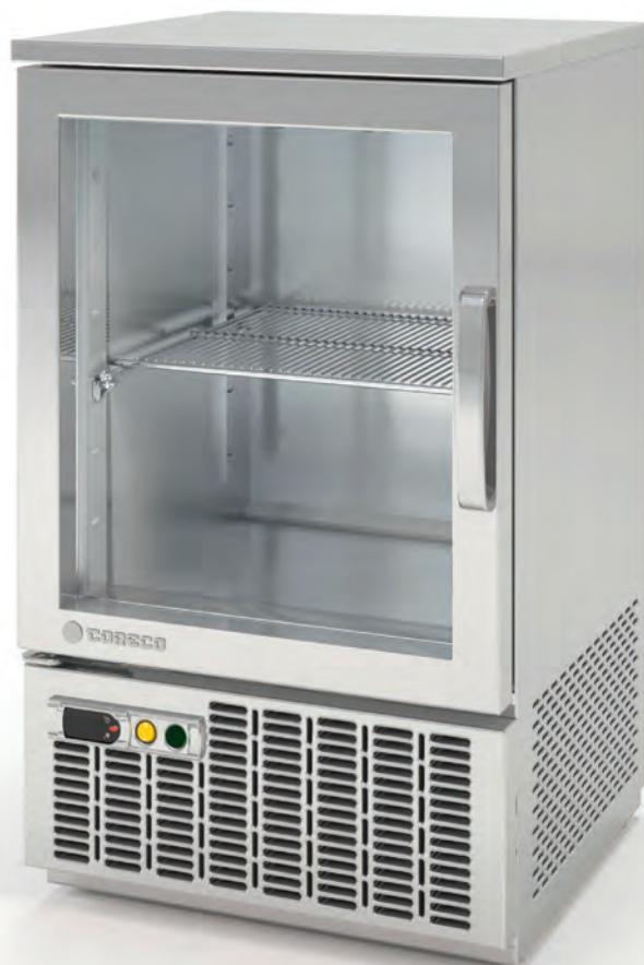
EE - 85