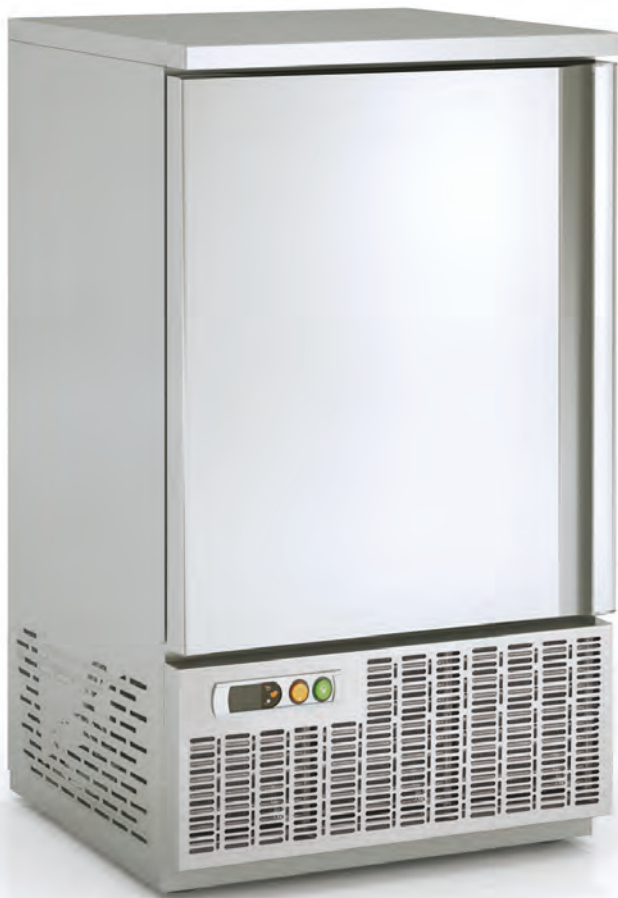
EC - 85